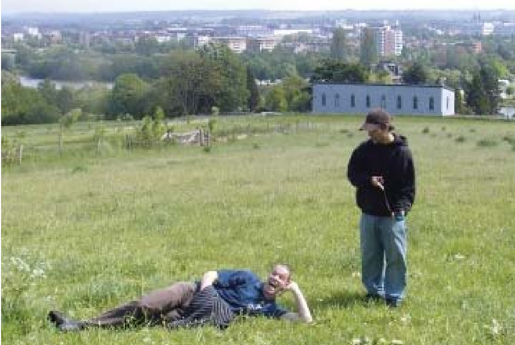
Stap 1: Zoek een geschikt slachtoffer