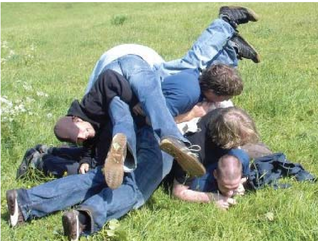
Stap 3: De rest gaat vanzelf