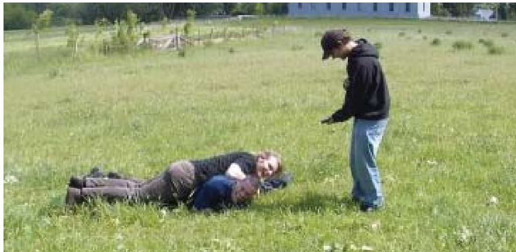
Stap 2: Werp jezelf erop en roep 'Hoopje!'