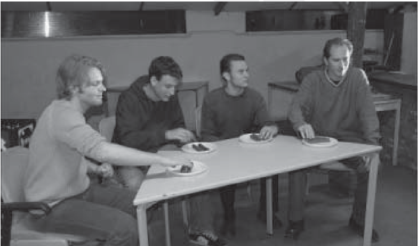
De enige echte frikadelleneetwedstrijd!

Op zaterdag moesten we allemaal vroeg uit de veren om te ontbijten en vervolgens te verzamelen bij de voet van de Sint Pietersberg. Het was tijd voor een heuse GPS tocht! In twee teams probeerden we middels een GPS unit en een primitieve map coördinaten te vinden. Dit bleek voor één